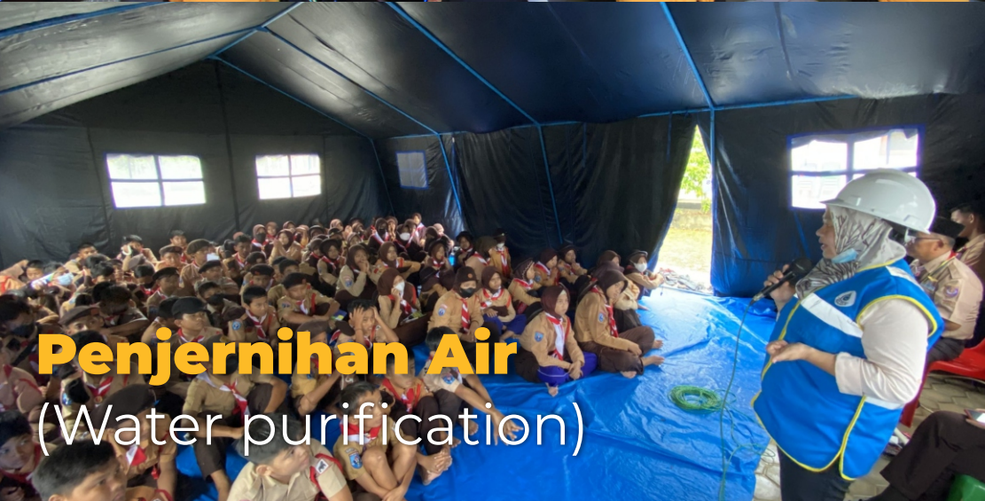
Penjernihan Air (Water purification)