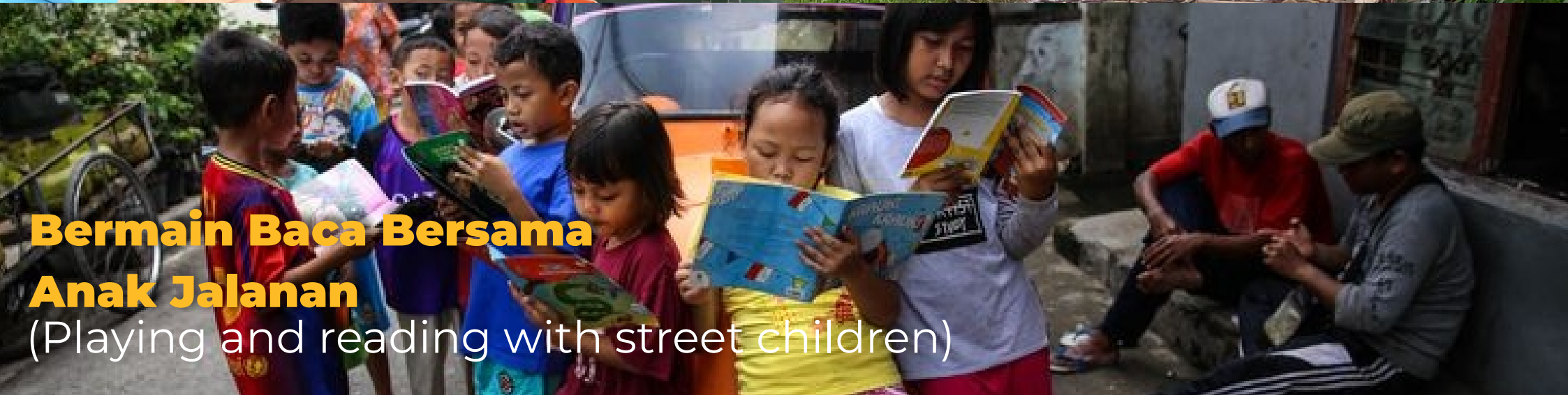
Bermain Baca Bersama Anak Jalanan (Playing and reading with street children)