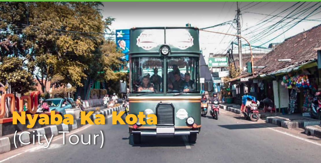
Nyaba Ka Kota (City Tour)