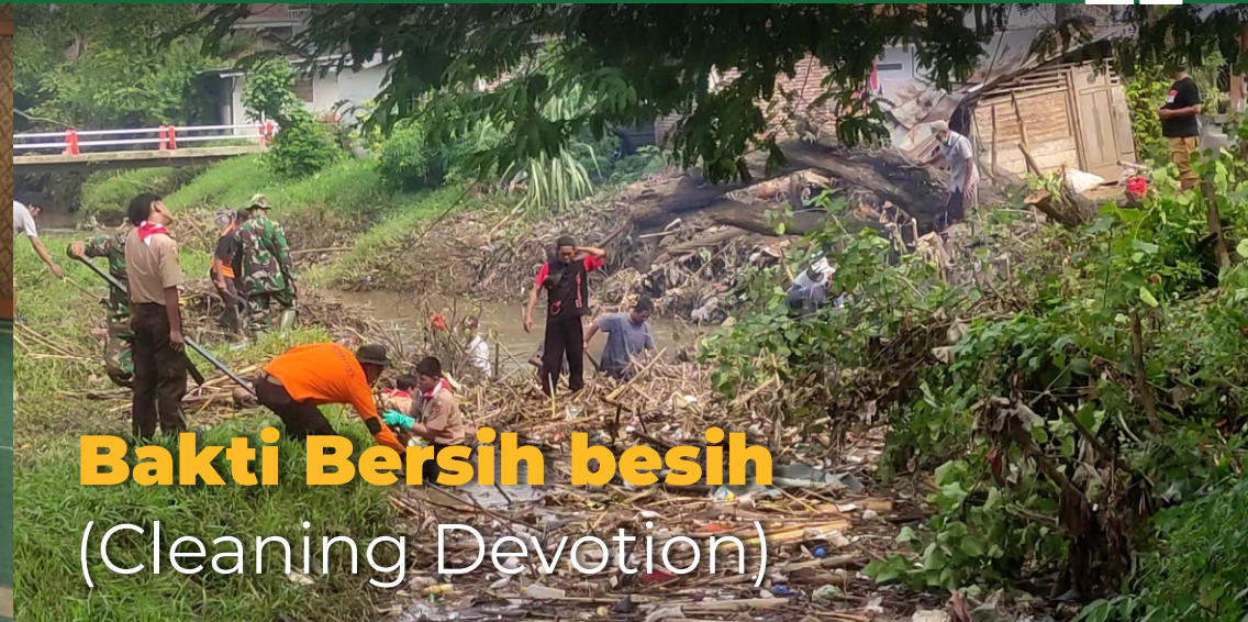
Bakti Bersih bersih (Cleaning Devotion)