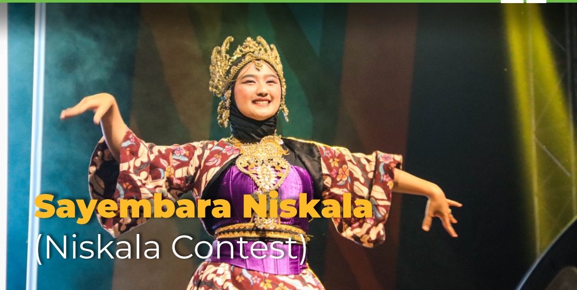
Sayembara Niskala (Niskala Contest)