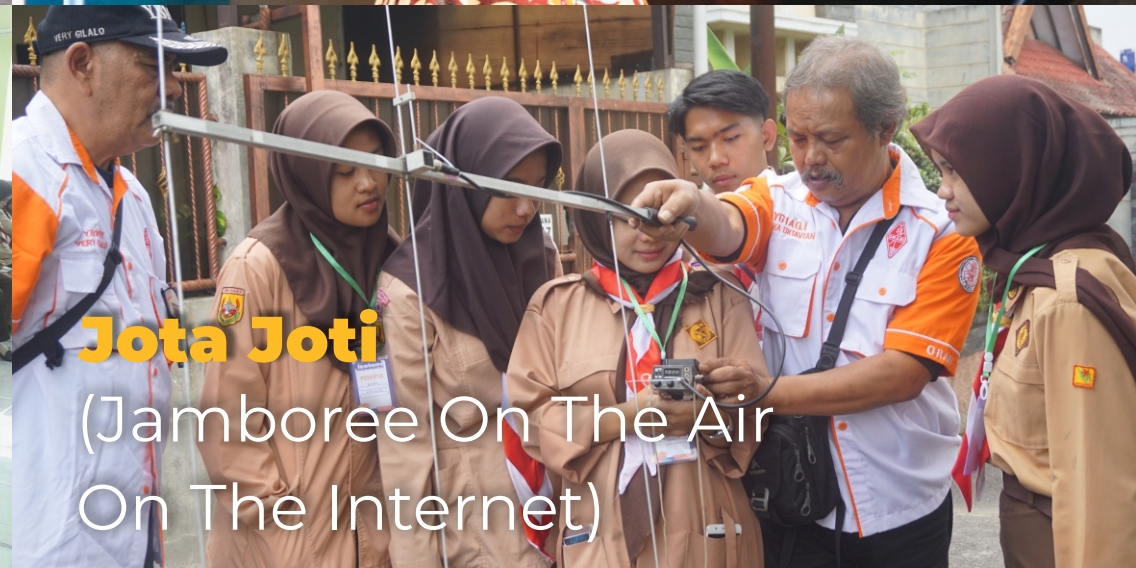
Jota Joti (Jamboree On The Air On The Internet)