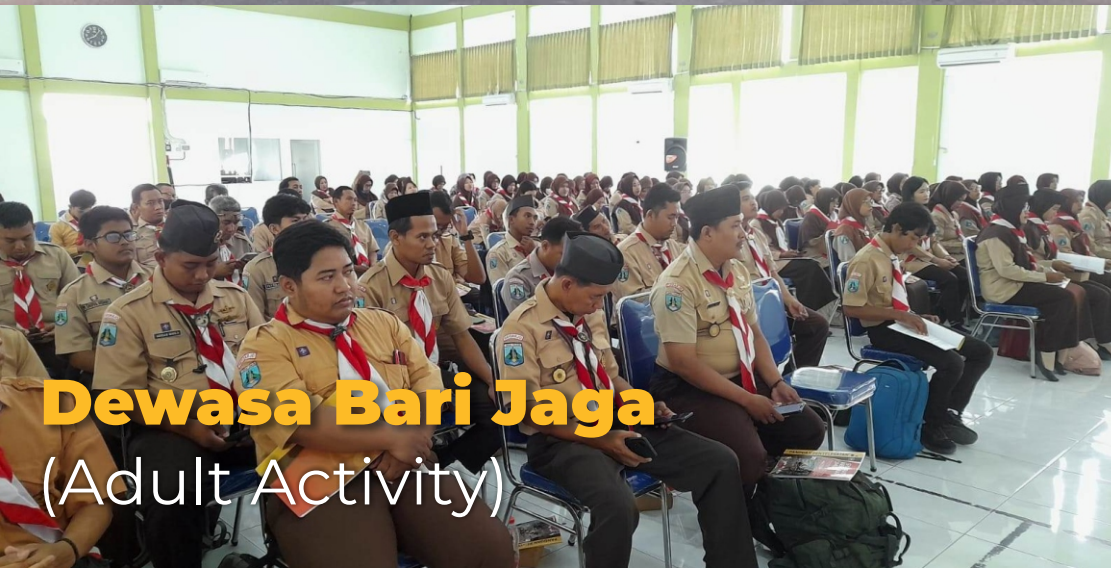
Dewasa Bari Jaga (Adult Activity)