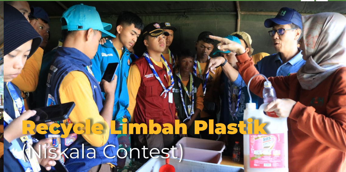
Recycle Limbah Plastik (Niskala Contest)