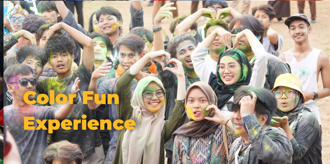
Color Fun Experience