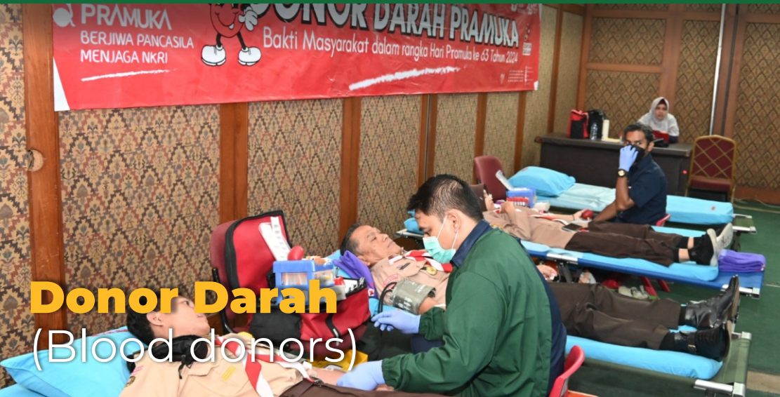
Donor Darah (Blood donors)